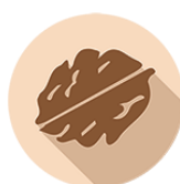
FRUTTA A GUSCIO