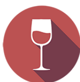
ANIDRIDE SOLFOROSA E SOLFITI

Caro ospite, le informazioni circa la presenza di sostanze o di prodotti che provocano allergie o intolleranze sono disponibili rivolgendosi al personale in servizio.