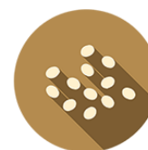
SEMI DI SESAMO