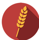
CEREALI CONTENENTI GLUTINE